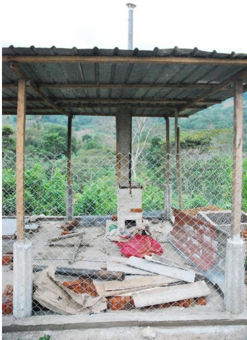
2 De incinerator vlak voor de eerste verbranding

Met grote vreugde kunnen wij melden dat de incinerator in Yalanhuitz zijn eerste afval heeft verbrand. De regelmatige lezers zullen zich nog herinneren dat dit project het laatste paradepaardje is van de clínica in Yalanhuitz: een verbrandingsoven die in staat is om (medisch) afval op zodanige hoge temperaturen te verbranden (om en bij de 1000 graden), dat de moleculen van het afval gebroken worden. Dit zorgt ervoor dat de chemische uitstoot tot een minimum beperkt wordt.